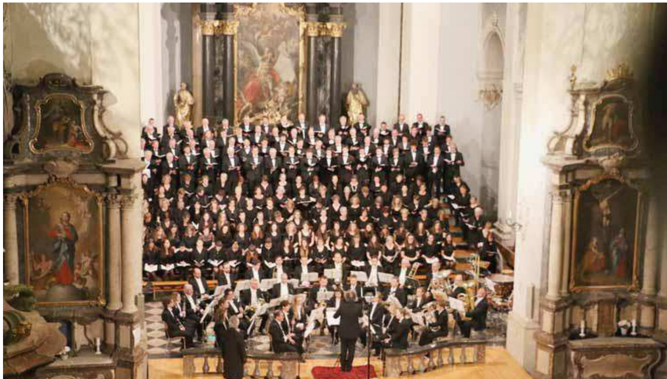
Les trois chœurs se retrouveront ensemble sur scène, comme ici lors d'un précédent concert commun.