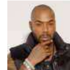
LORD KOSSITY RAPPEUR AUX CÔTÉS DE NTM

Le chanteur parisien sera sur scène avec NTM, samedi à Paléo. Notamment pour interpréter le tube «Ma Benz».